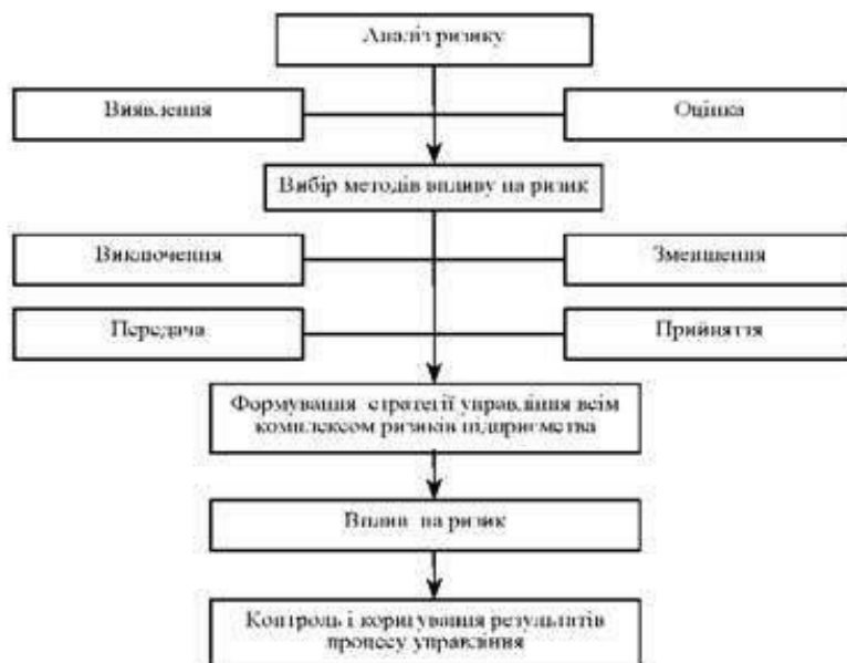
Рис. 2 Загальна схема процесу управління ризиком

Політика учасника ЗЕД щодо потенційних 1. Виключення ризиків - це відмова від здійснення будь-яких дій, пов'язаних з можливістю появи ризиків у ЗЕД.