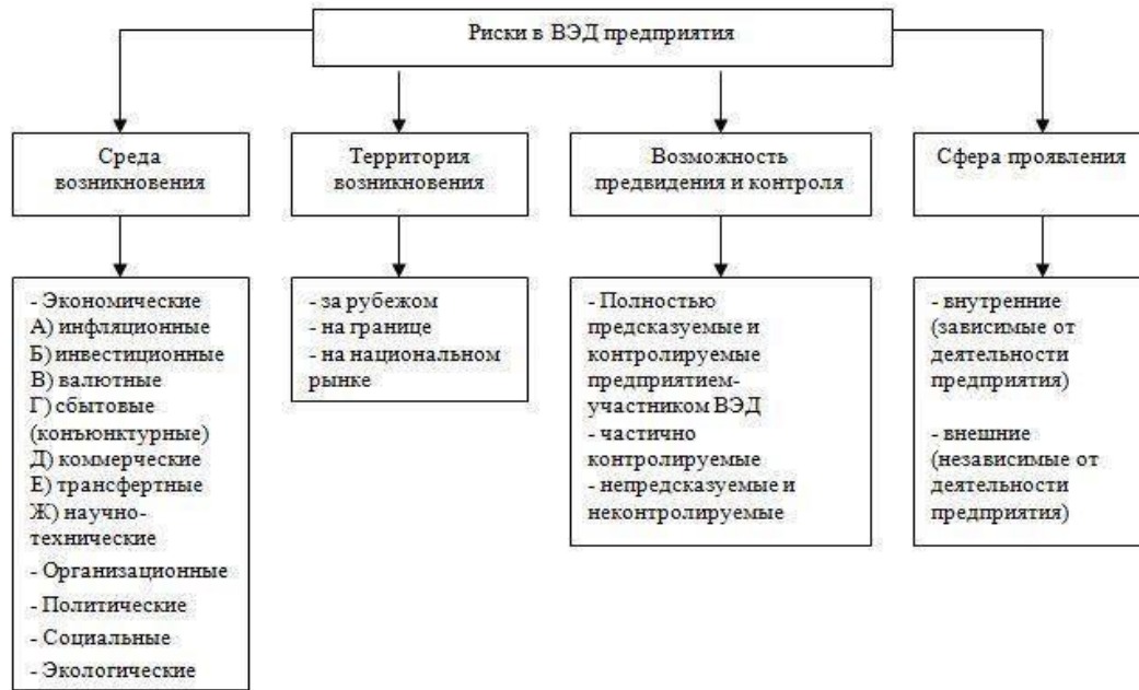
Рис. 1 Схема классификации рисков в ВЭД предприятия

Ризики у зовнішньоекономічній діяльності - збитки для учасника ЗЕД. Схема класифікації ризикоможливі несприятливі події, які можуть статися і в ків представлена на Рис. 1: результати яких можуть виникнути збитки, майнові